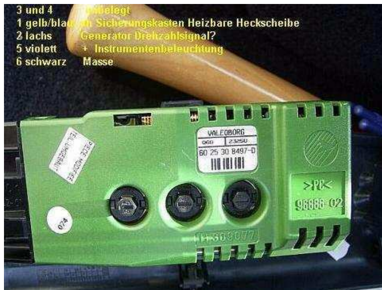
DZM für Benzin Modelle