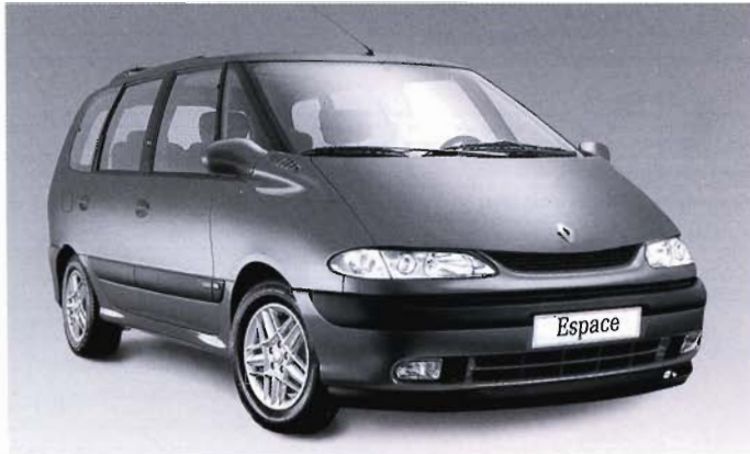
Renault Espace The Race